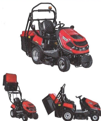
Traktor Seco MP 122 D

Na realizaci projektu byla získána dotace ve výši 385 264 Kč (dotace 80 %).